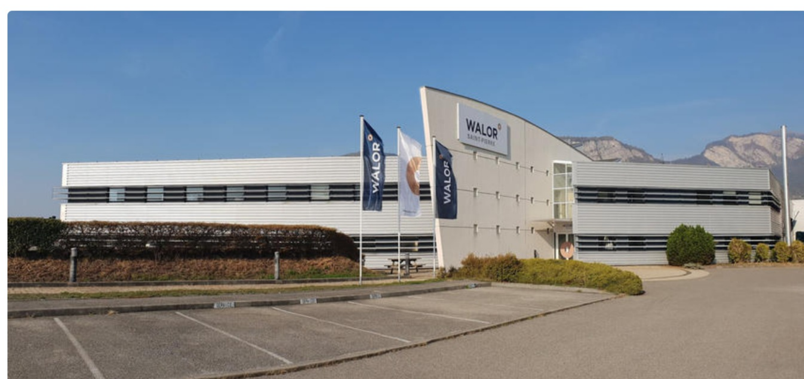
Usine Saint-Pierre

PAR AURORE BARLIER | 22 avril 2020 | 657 mots - 7 conseil(s)